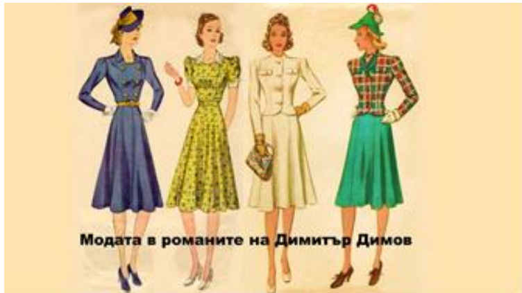
Модата в романите на Димитър Димов

По случай 26 април – Световния ден на модата, ученици от 10 и 11 клас от професионално