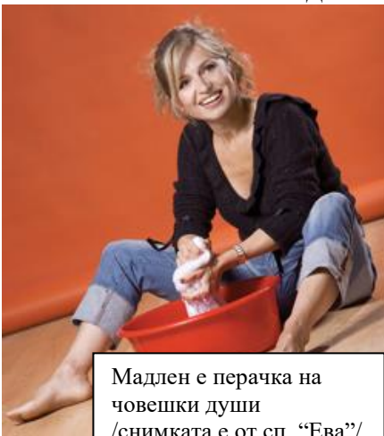
Мадлен е перачка на човешки души

Г-жо Алгафари какво е отношението Ви към психологическите методи на Дж. Кехоу, според когото, когато повтаряш или си мислиш често за нещо, представяш си го – то се случва?