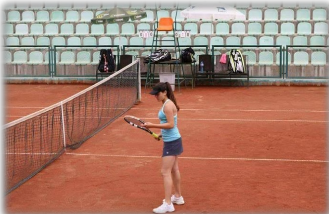
Изготвил: Виргиния Петкова 9А клас