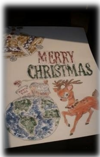
IX а клас