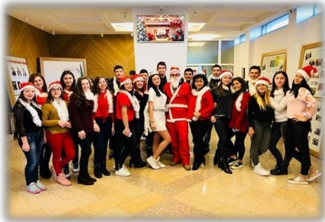
IX а клас

В конкурсите участваха ученици от VIII до XII клас. Те се забавляваха, украсявайки класните си стаи, под звуците на коледни песни, изработваха картички с коледни пожелания, а някои от тях, отдадени на коледната магия, се превърнаха в дядо Коледа и Снежанка.